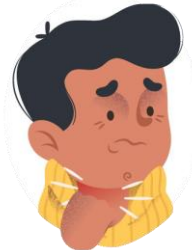
Dolor de garganta y de pecho