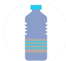
Por tocar objetos contaminados por el coronavirus