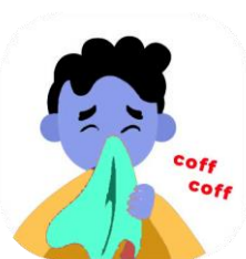
Toser y estornudar cubriéndome la boca con un pañuelo desechable