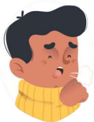
Tos seca y dificultades para respirar