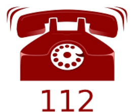
Llamar al teléfono de emergencias 112 si tengo alguno de los síntomas anteriores