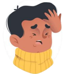
Dolor de cabeza y cansancio