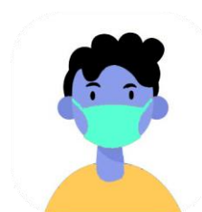
Evitar el contacto con personas enfermas. Utilizar mascarilla si estoy enfermo